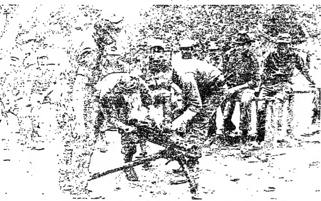
تدرب بال سلاح المتطوعين في قاعدة شديدة التمويه على حدود هندوراس

على الحدود بين هندوراس ونيكاراغوا. يتدرب الثوار المنتمون للثورة النيكاراغوية في حرب عصابات لم تعهدوا حتى اليوم الدول البريكانية في أميركا الوسطى واللاتينية. هؤلاء الثوار الذين يجري تطهيرهم في نطاق - القوة الديمقراطية النيكاراغوية - يؤكّدون انهم يمكنهم ١٧ ألف مقاتل. بينهم ٢٠ ألف عنصر من قوى الاستد. وثمة معلومات أخرى يجري تسويقها في ماناغوا. حول إمكانية امتلاك - القوة الديمقراطية النيكاراغوية - نحو ٤٠ ألف مقاتل في الأشهر الستة المقبلة. إضافة إلى ترسانة السلاح المتطورة... الامر الذي يمكنها من انتزاع الانتصار على نظام الرئيس اورتيغا الملقب بالقائد صفر. كل المؤشرات تدل ان الاعداد الأخيرة من المتطوعين الذين لحقوا إلى معسكرات التدريب التابعة - القوة الديمقراطية النيكاراغوية - هم - في غالبيتهم - من الجنود المتطوعين الذين فروا من القوات الشرعية. والتحقوا بقواعد - شديدة التميؤ - مزروعة في مهب الإصراع.